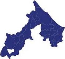
Tabella comuni Rimini