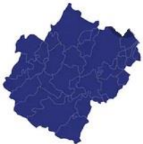
Tabella comuni Cesena